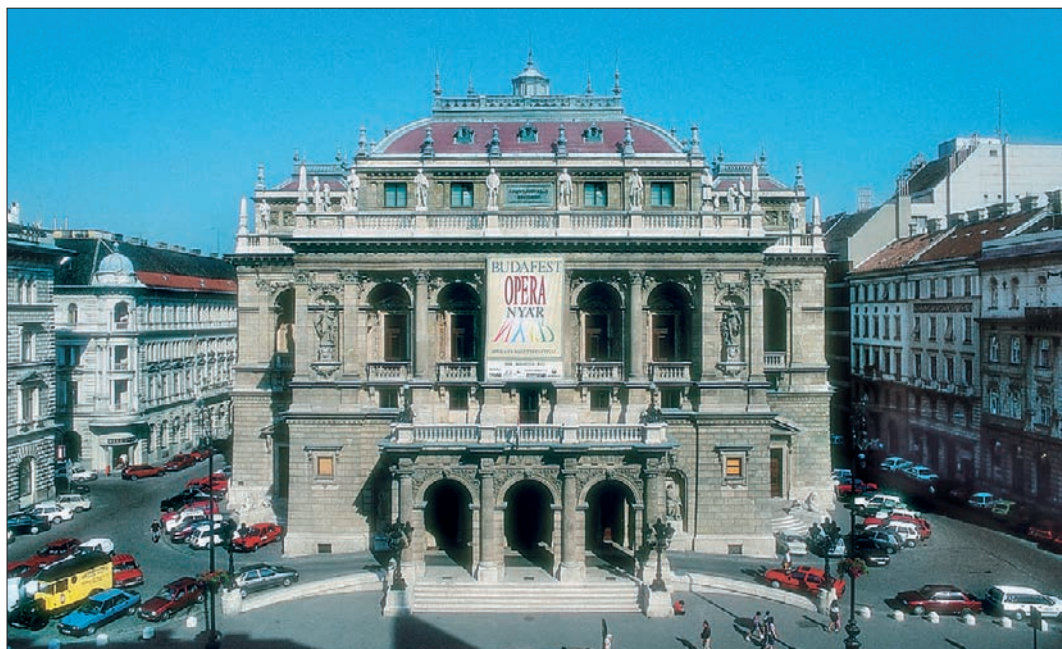
A Magyar Állami Operaház Budapesten

„A szolfézs a zeneértés alfája és omegája. A zenei írás-olvasás alapos elsajátítása nélkül a zene továbbra is megfoghatatlan, misztikus valami marad. A zenei valóság csak biztos írás-olvasás révén lehet tudatos.