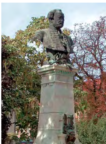
Erkel Ferenc szobra Gyulán, a róla elnevezett téren

E gyulán, 202 éve született a 19. századi magyar zene kiemelkedő alakja, a magyar romantika óriása, a magyar nemzeti opera megteremtője, a kor nagy tehetségű karmestere, zongoraművésze, pedagógusa, kórusmozgalmunk kibontakoztatója: Erkel Ferenc .