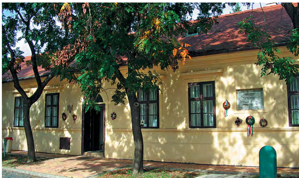
Erkel Ferenc szülőbáza Gyulán, ma emlékmúzeum.

Erkel Ferenc a magyar kultúra nagy hitelezői közé tartozik: tartozásunk van vele szemben. Bárhonnan indult is el műve, ha nem jutott is, nem juthatott el a magyar zene legmélyebb forrásrétegéig, zenéjét a magáénak, magyarnak és életérzését felemelőnek, nemesnek és gyönyörködtetőnek érzi népünk. Szélesebben, mélyebben kell feltárnunk a benne rejlő hagyatékot, ezt a minden ízében haladó hagyományt, és szélesebben, mélyebben kell belevinnünk a magyar nép tudatába, szívébe, szeretetébe.