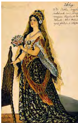
Melinda jelmezterve

1853-ban Erkel életre hívta a Filharmóniai Társaságot, amely hamar meg is tartotta bemutató hangversenyét. Ezzel Pestnek színvonalas zenekara támadt, amelynek irányítása avatott kezekbe került. A repertoár gerincét Berlioz és Wagner, Liszt és Mosonyi művei adták. Az 1890-es búcsúzásig Erkel összesen 61 koncertet vezényelt és 4 zongorafellépése volt. 1857-ben új operával jelentkezett, az Egressy szövegére írt „Erzsébet”-tel, amelyik már nem teljesen Erkel Ferenc műve. A zenetörténészek Erkel-műhelynek nevezik azt a munkaközösséget, akik Erkel irányítása mellett a hangszerelés aprólékos munkáját végezték. Az „ Erzsébet ” elkészültéhez a Doppler-testvérek nyújtottak segítséget. Az opera 16 előadás után lekerült a színpadról.