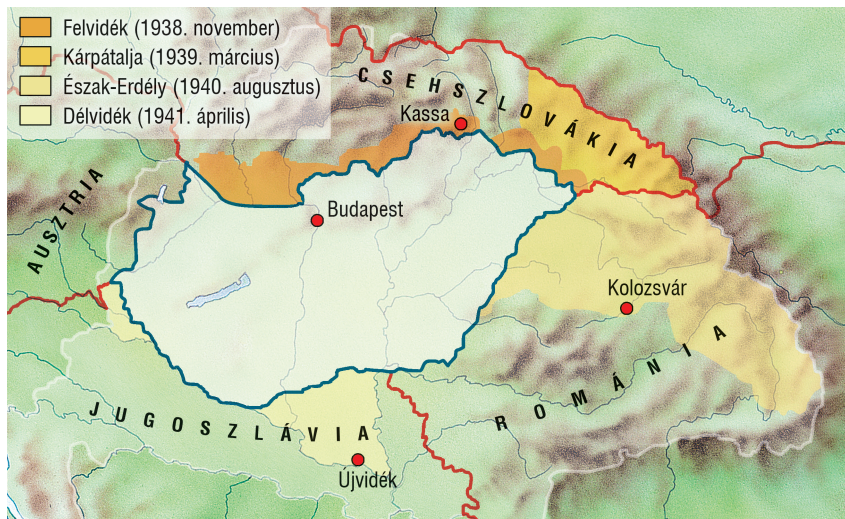
Magyarország területgyarapodása 1938 és 1941 között