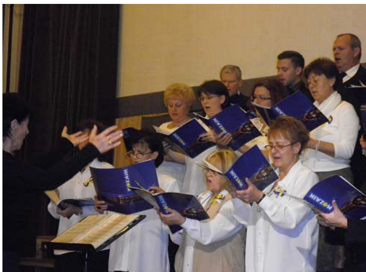
Az estét könnyed dallamok zárták

Évente egy alkalommal (összel), különleges kórustalálkozóra hívjuk az ország ének-zene tanárait. Ez a nap mindig szombatra esik, 10 órakor kezdődik próbákkal, 18 órakor folytatódik koncerttel és egy kellemesen eltöltött beszélgetős vagy táncos estével zárul. Különlegessége abból adódik, hogy az ország bármely részéből lehet csatlakozni a mindig változatos Mozaik Kórushoz.