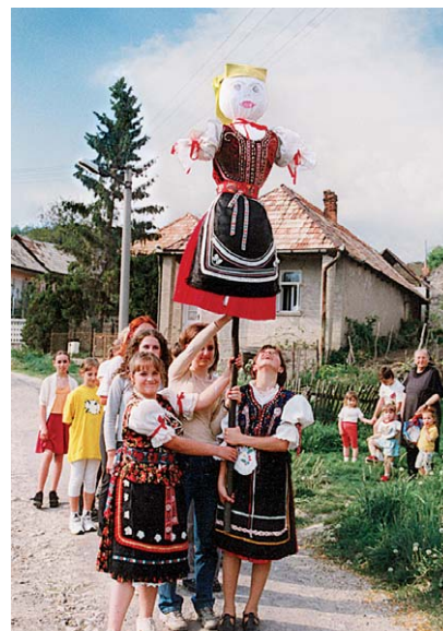
Virágvasárnapi kiszebajtás, Ipoly-mente