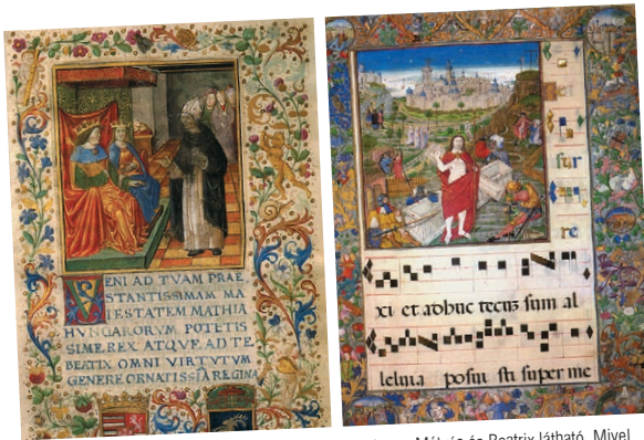
91.1. Gazdagon díszített corvinák. A bal oldali kódexlapon Mátyás és Beatrix látható. Mivel a könyveket kézzel írták és festették, ritkák és rendkívül drágák voltak

Visegrádi és budai palotájának építkezésein külföldi mestereket, szobrászokat alkalmazott. Azt szerette volna, hogy fényes udvarával, a pezsngó szellemi élettel minden vendégét elkápráztassa.