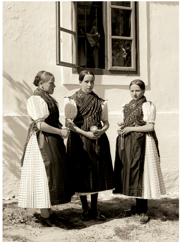
Eladó sorban lévő lányok