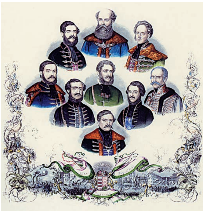
Az első magyar felelős kormány (Magyar Történelmi Képcsarnok)