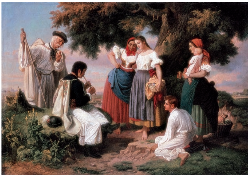
Jankó János: A népdal születése (Magyar Nemzeti Galéria)