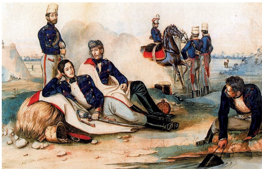
Than Mór: A Károlyi huszárezred tisztjei

loncsolják*: francia eredetű szó (longe), jelentése: a ló futószárral történő körbefuttatása.