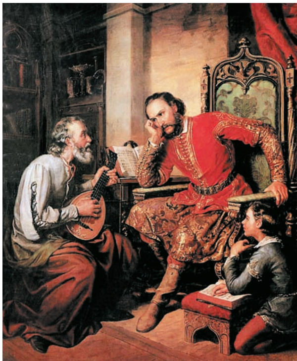
Orlay Petrich Soma: Nadasdy Tamás és Tinódi