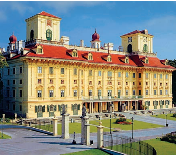
Az Esterházy-kastély Eisenstadtban (Kismarton)

Egy prágai felkérést így hátrított el: „A nagy Mozart mellé aligha lehet bárkit is állítani!”