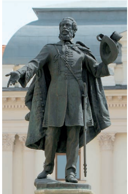
Kossuth szobra a szegedi Klauzál-téren

A dalt Kodály Zoltán dolgozta fel a Hány János című daljátékában.