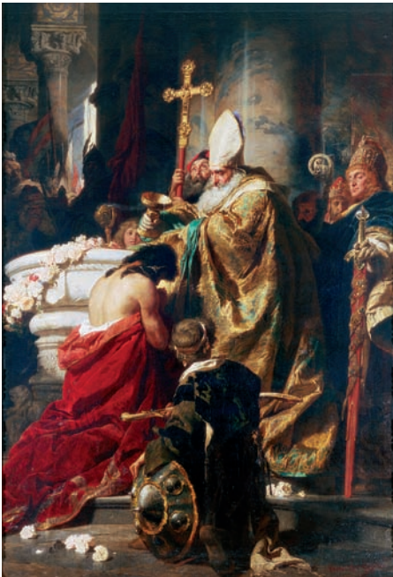
Benczúr Gyula: Vajk megkeresztelése (Magyar Nemzeti Galéria)